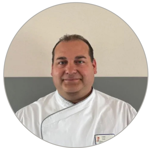
Paul Viard Centre hospitalier d'Albert Albert (80)